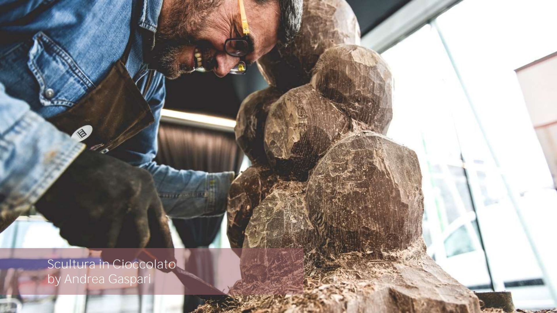
Scultura in Cioccolato by Andrea Gaspari