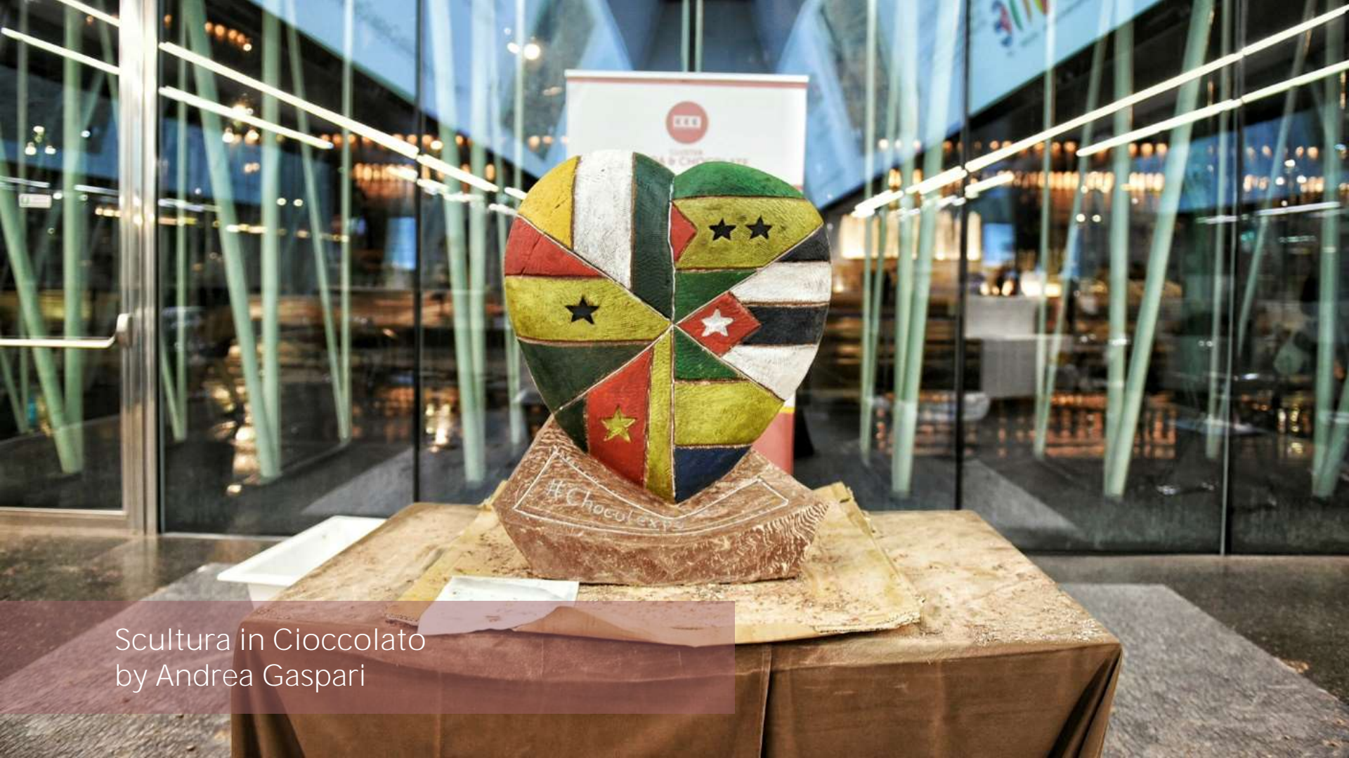
Scultura in Cioccolato by Andrea Gaspari