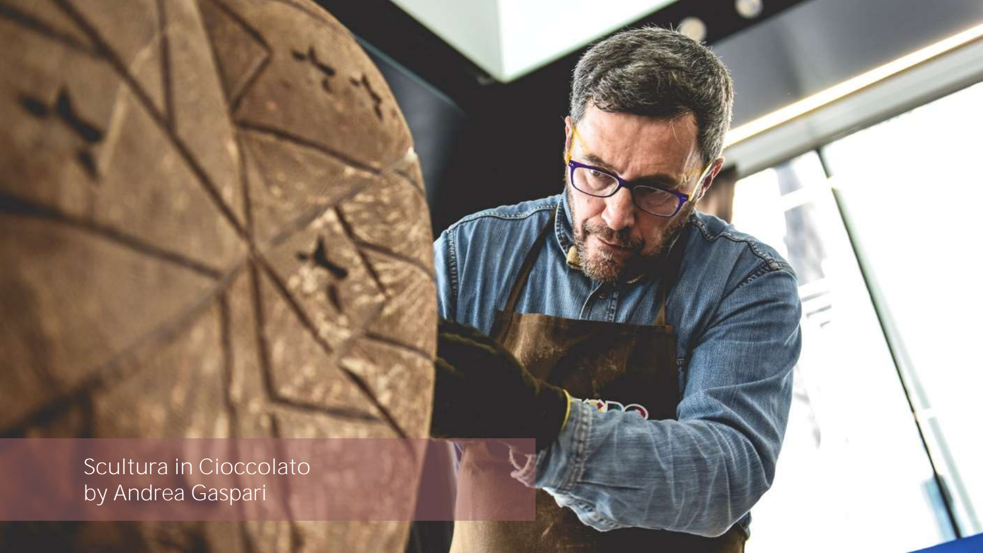
Scultura in Cioccolato by Andrea Gaspari