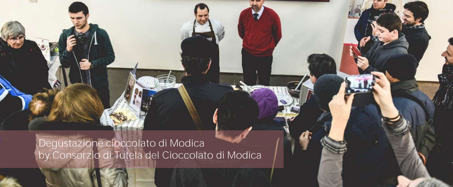
Degustazione cioccolato di Modica by Consorzio di Tutela del Cioccolato di Modica