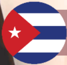
Alba Beatriz Soto Pimentel Ambasciatrice di Cuba