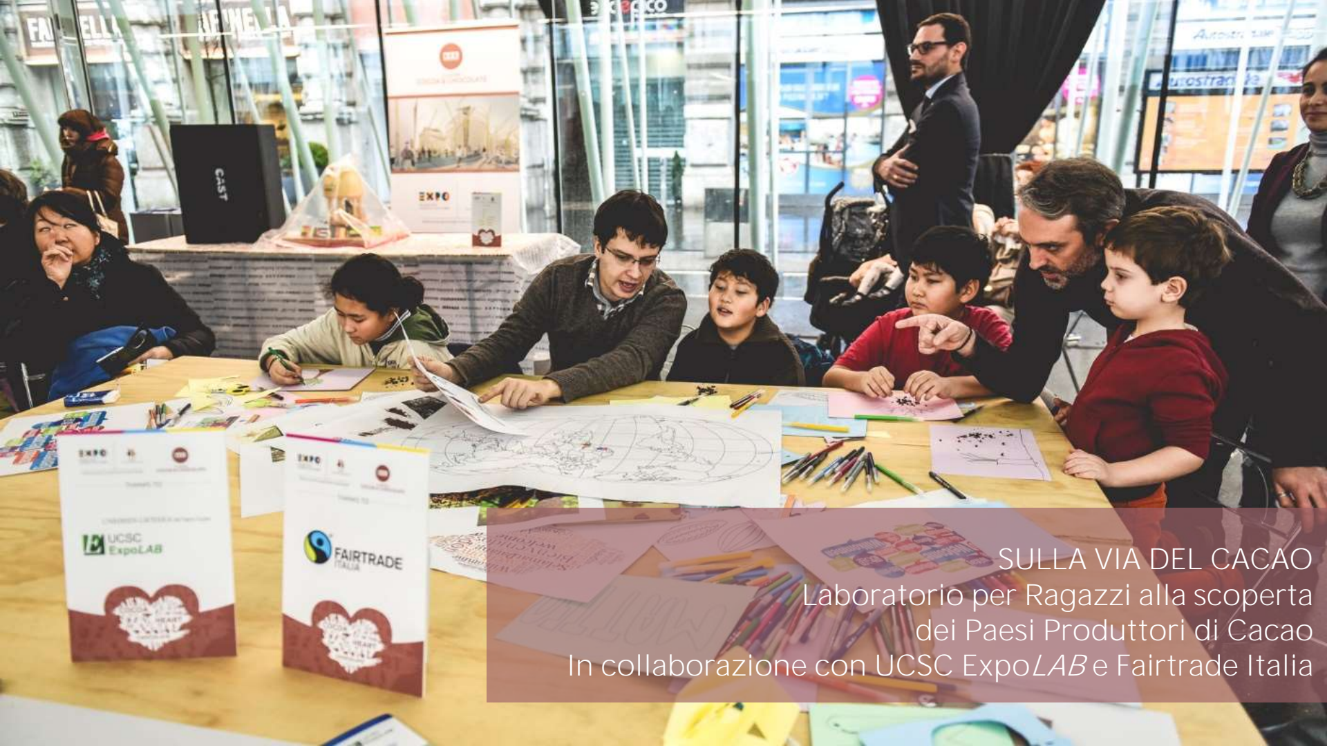
SULLA VIA DEL CACAO Laboratorio per Ragazzi alla scoperta dei Paesi Produttori di Cacao In collaborazione con UCSC ExpoLAB e Fairtrade Italia