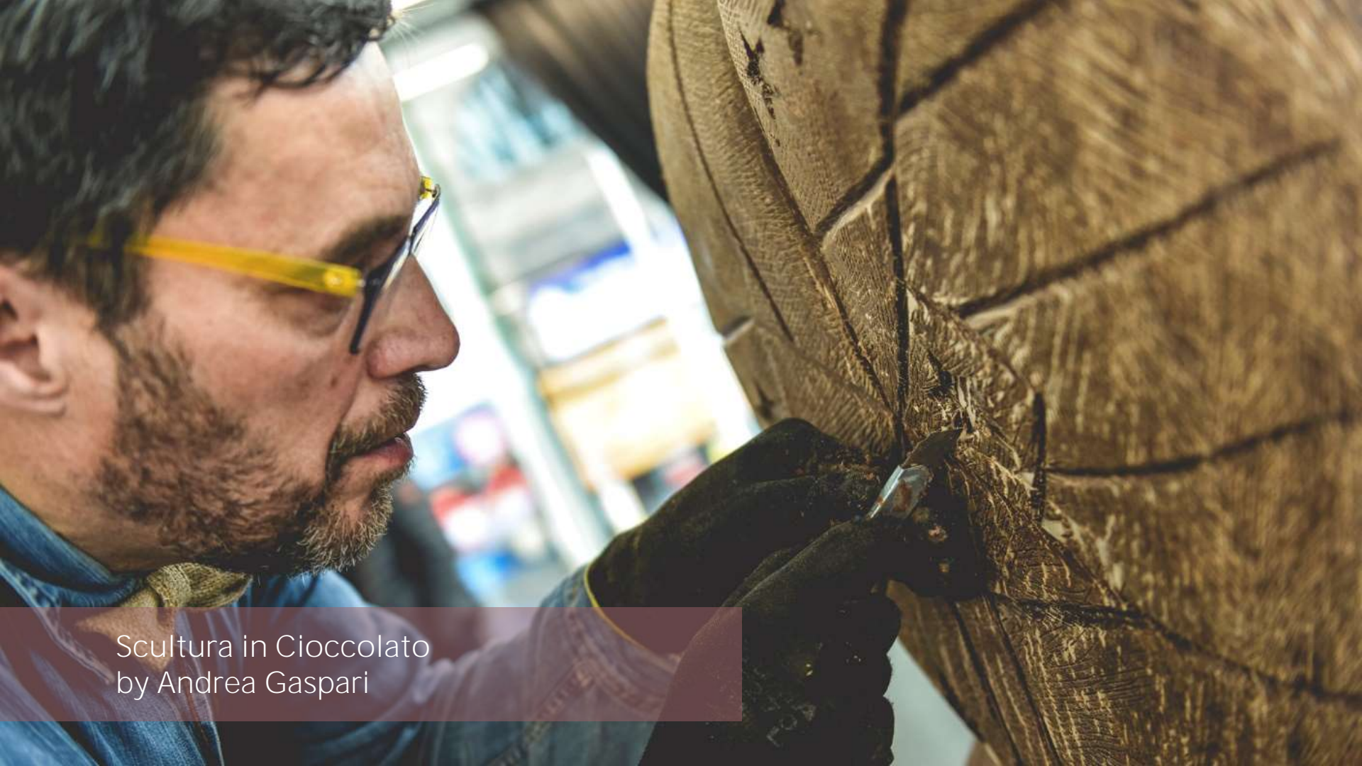
Scultura in Cioccolato by Andrea Gaspari