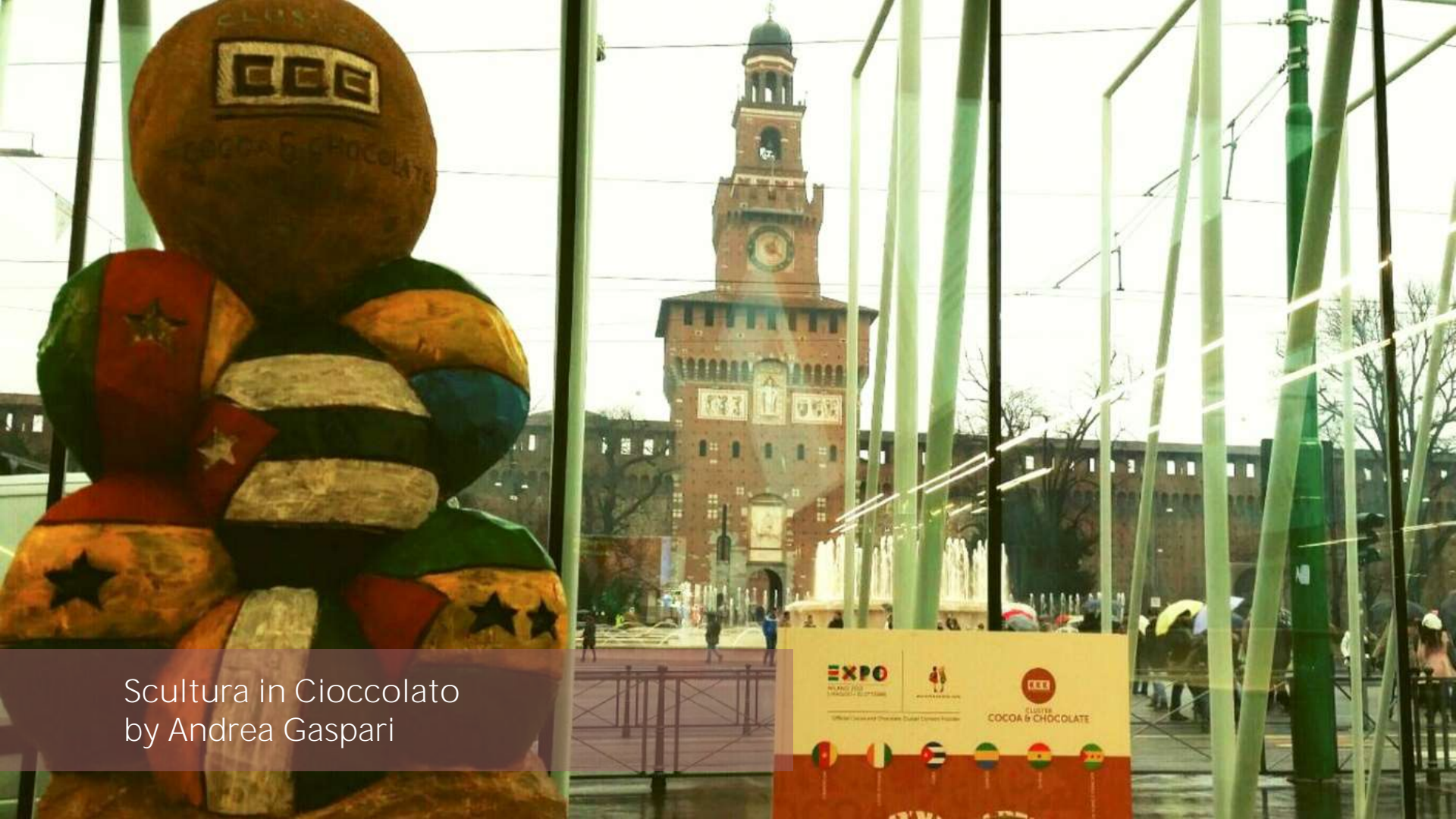
Scultura in Cioccolato by Andrea Gaspari