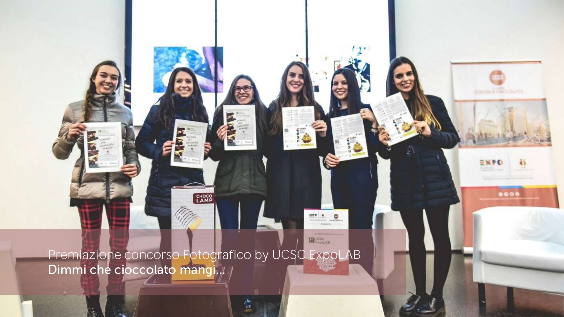
Premiazione concorso Fotografico by UCSC ExpoLAB Dimmi che cioccolato mangi...